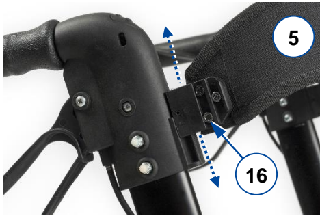
Figure 3 : insérer/retirer la ceinture de soutien dorsal

Pour la démonter, faites à nouveau coulisser la base jusqu'à ce que l'extrémité du soutien dorsal se déboîte.