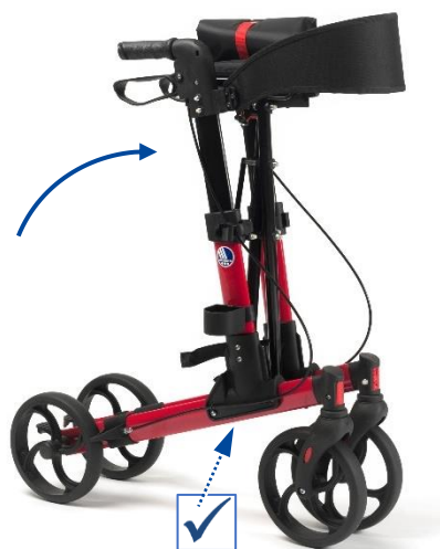
Figure 1 : déplier le rollator