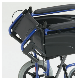
Dossier pliant à mi hauteur