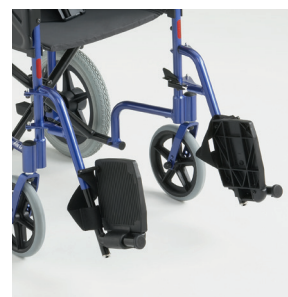
Palettes relevables et potences escamotables & amovibles

Permet de réduire la hauteur du fauteuil pour le transport et le rangement.