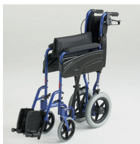
Châssis pliant par croisillon